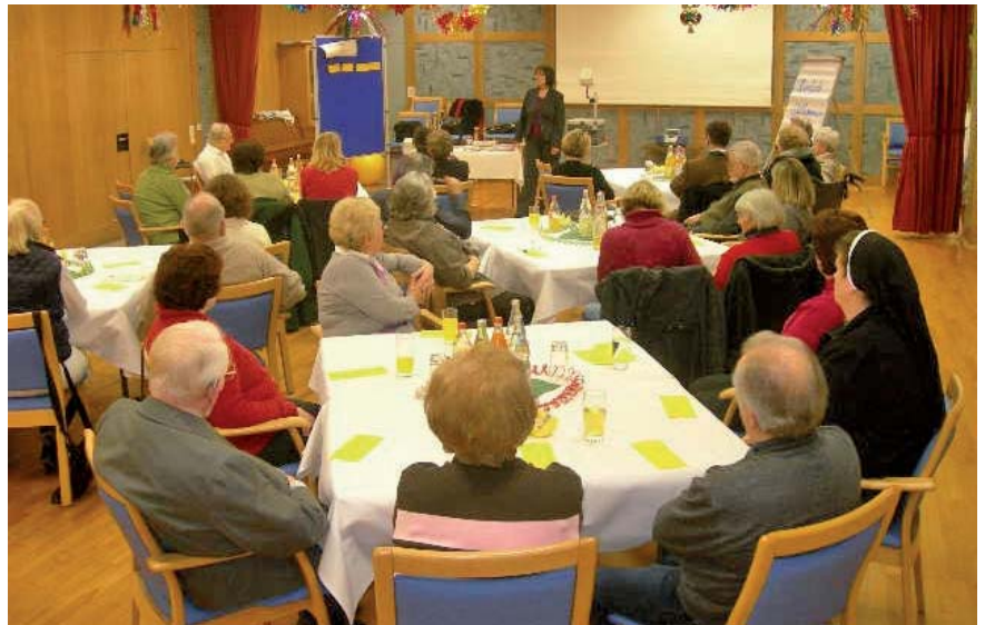
Großes Interesse beim Angehörigenabend

Oft sind die Veränderungen von Vater, Mutter, Onkel, Großmutter im Alter so gravierend, dass sie nur schwer nachvollziehbar sind. Wie soll man reagieren? Wie gehen Mitarbeiter eines Altenheimes mit meinen Angehörigen um? Diese Fragen waren Grund des großen Interesses und haben zu einem interessanten Austausch im Gespräch geführt.