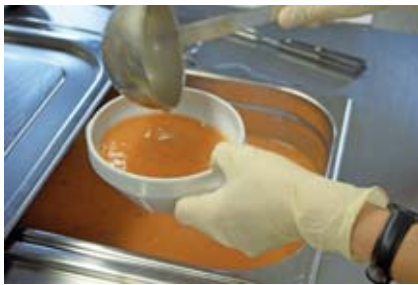
Verpflegung und Service

Hier werden Helfer und Helferinnen für folgende Zweige ausgebildet: