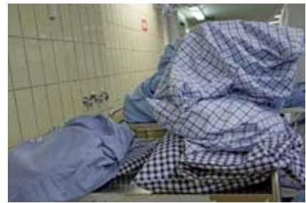
Textilreinigung und Service

In der Regel dauert diese Ausbildung drei Jahre. In vielen unterschiedlichen Bereichen der Hauswirtschaft wird man mitarbeiten und viel Neues erlernen. Am Ende gibt es auch eine Prüfung.