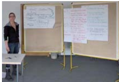
Gabriele Wiesmüller stellt ihren Zuständigkeitsbereich vor

Auch das Thema Schwimmbad regte zu heftigen Diskussionen an. Die hohen Unterhaltskosten und die im Verhältnis geringe Belegung des Schwimmbades durch die Wohngruppen ließ die Frage aufkommen, ob wir ein Schwimmbad für externe Nutzer betreiben, oder ob nicht die in der Einrichtung lebenden Menschen den größten Nutzen davon haben sollten. Darin waren sich alle einig und mit unterschiedlichen Vor-