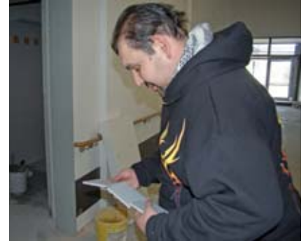
So sehen also die neuen Kacheln aus