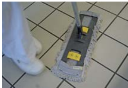
Hausreinigung und Service