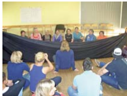
Wer ist hinter der Mauer?