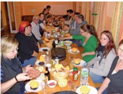
Am Abend gibt's Raclette