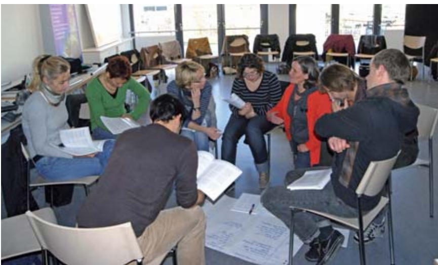
Mitarbeiter der Förderstätte bei der Gruppenarbeit zum UN-Übereinkommen

Klausurtagung der Mitarbeiterinnen und Mitarbeiter der Förderstätte