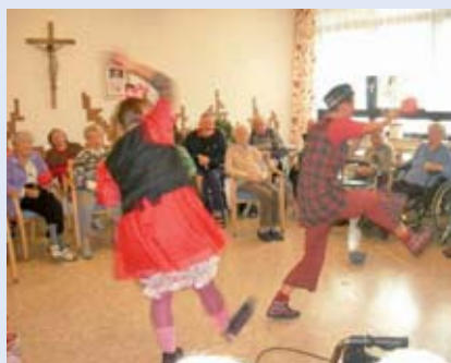
Spaß mit den Klinikclowns