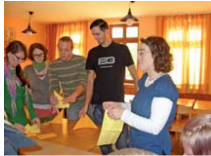
Serviertentechniken für den festlich gedeckten Tisch