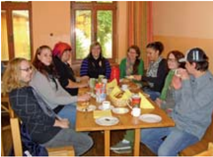
Mit einer Brezen Brotzeit beginnen die Tage