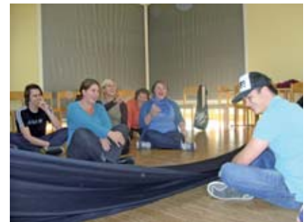
Ein Punkt für die „Drüberen“