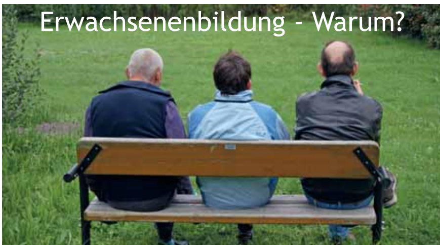
Bildung ist für alle wichtig - ein Leben lang!