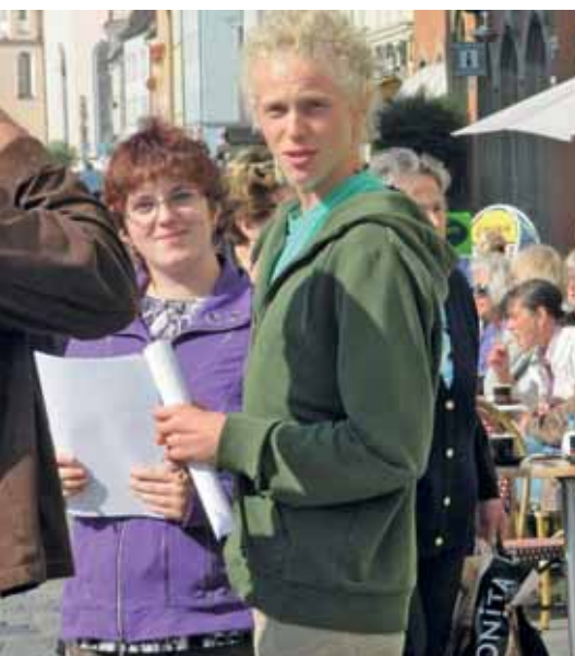
„Stadtrallye“ mit Passantenbefragung zum Berufsbild