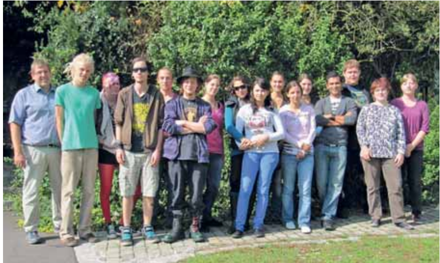
Der diesjährige HEPH-Kurs

Kernzentrum der Ausbildung ist das Marienheim in der Wittelsbacherstraße, wo