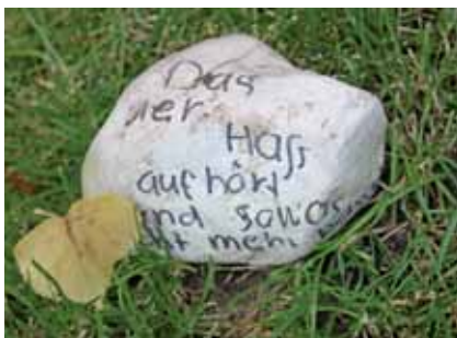
Die Teilnehmer der Bildungsangebote zum Thema „Euthanasie“ gestalteten Steine mit ihren Wünschen für die Zukunft

So steht es auf der Gedenktafel, die neben dem Mahnmal auf dem Gelände steht. Das Mahnmal wurde im Rahmen des 125-jährigen Jubiläums im letzten Oktober geweiht und erinnert seit dem an die Opfer des Nationalsozialismus. Das Mahnmal weist darauf hin, was geschehen ist und ist auch Mahnung für das Heute. Damit wir alle für das Recht auf Leben und für die Würde jedes Men-