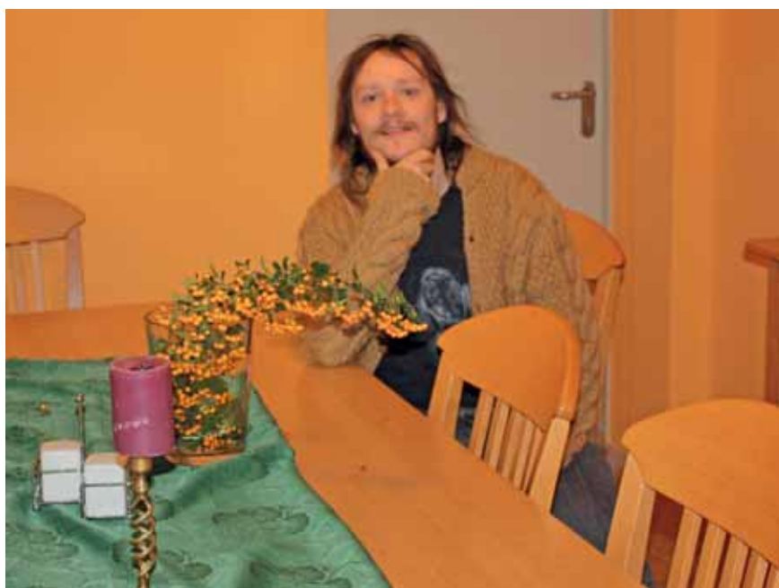
Hier lässt es sich leben!

Wir unterhalten momentan vier Außenwohngruppen, das Haus Stephanus mit 13 Bewohnerinnen und Bewohnern, Haus Antonius mit 7 Bewohnerinnen und Bewohnern - beide in der Schlesi-schen Straße, Gruppe Matthäus mit 12 Bewohnerinnen und Bewohnern und Haus Franziskus mit 13 Bewohnerinnen