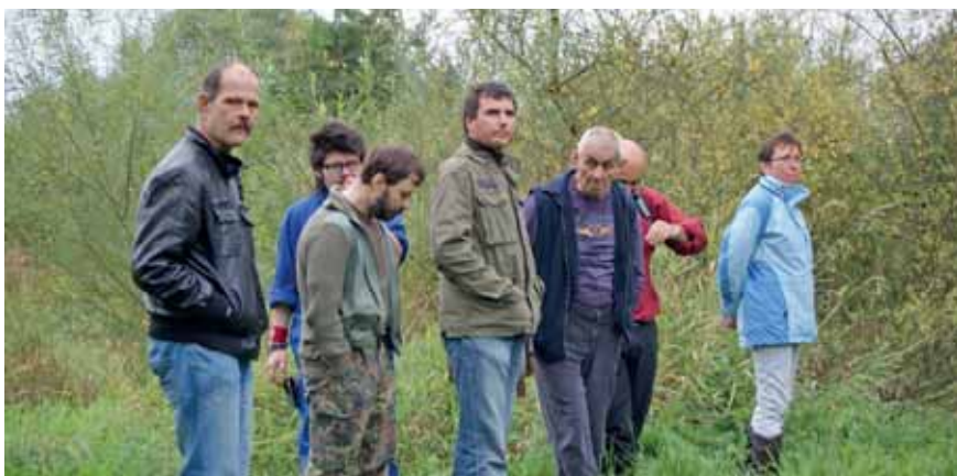
Jeder entscheidet selbst, wie intensiv er sich mit einem Thema auseinandersetzt.