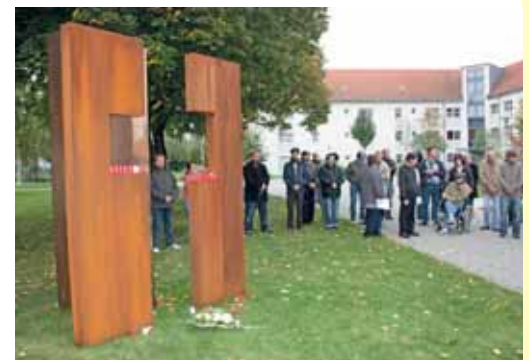
Gemeinsames Gedenken am Mahnmal